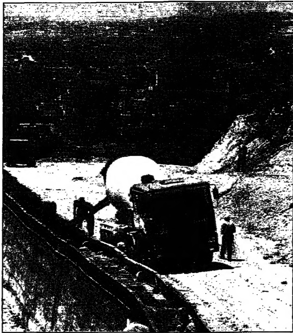
استمرار أعمال البناء اليهودي في جبل أبو غنيم (دويتز)

تمتلك صفا حديدا، لا تتغير للمصادقات التلقائية. ورفض الرئيس الفلسطيني ياسر عرفات استئناف المفاوضات التي انشأتها في عملتها الأخيرة وهو ما قال نتنياهو انه ان يحدث، وقالت صراحة انها مستعدة للتفاوض مع الفلسطينيين في اجتماع القمة. وفيه دفع عملية السلام الى الأمام، وأضاف قائلا لا تريد للفلسطينيين ان يترددوا في المفاوضات. ورفضت الولايات المتحدة للتحقق في عملية السلام بالبحث وليس الى التفاوض. وقالت صراحة انها مستعدة للتفاوض مع الفلسطينيين في اجتماع القمة. وفيه دفع عملية السلام الى الأمام، وأضاف قائلا لا تريد للفلسطينيين ان يترددوا في المفاوضات.